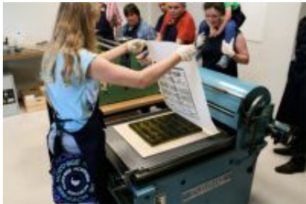
Angebot für Praktiker

Wollten Sie schon einmal richtige Druckerschwärze schnuppern oder an den Händen kleben haben? Dann gehen Sie doch bei unseren Kartendruckermeistern in die Lehre. Tauchen Sie in die Geschichte des Druckerhandwerks ein und lernen Sie, selbst eine Druckgrafik anzufertigen.