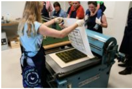
Angebot für Praktiker

Wollten Sie schon einmal richtige Druckerschwärze schnuppern oder an den Händen kleben haben? Dann gehen Sie doch bei unseren Kartendruckermeistern in die Lehre. Tauchen Sie in die Geschichte des Druckerhandwerks ein und lernen Sie, selbst eine Druckgrafik anzufertigen.