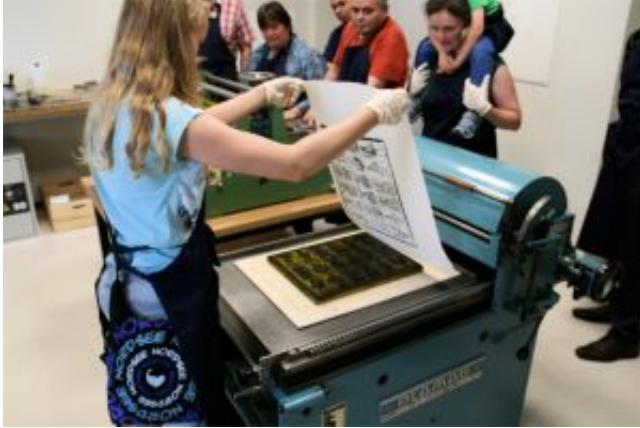
Angebot für Praktiker

Wollten Sie schon einmal richtige Druckerschwärze schnuppern oder an den Händen kleben haben? Dann gehen Sie doch bei unseren Kartendruckermeistern in die Lehre. Tauchen Sie in die Geschichte des Druckerhandwerks ein und lernen Sie, selbst eine Druckgrafik anzufertigen.