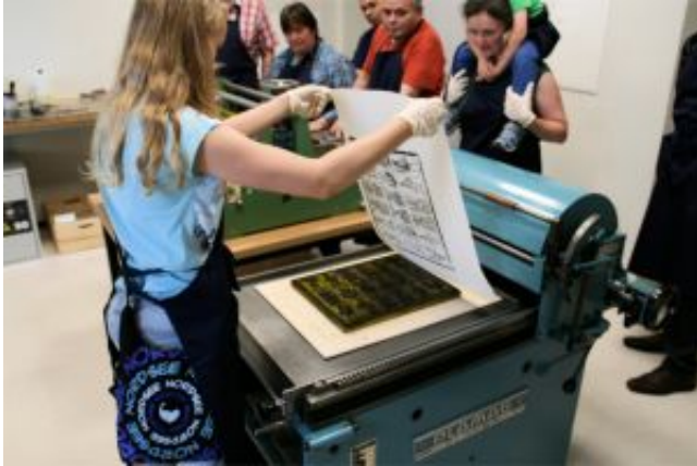
Angebot für Praktiker

Wollten Sie schon einmal richtige Druckerschwärze schnuppern oder an den Händen kleben haben? Dann gehen Sie doch bei unseren Kartendruckermeistern in die Lehre. Tauchen Sie in die Geschichte des Druckerhandwerks ein und lernen Sie, selbst eine Druckgrafik anzufertigen.